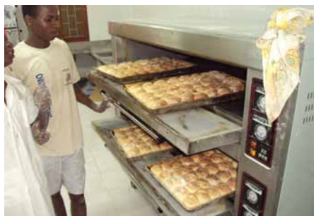
↑ La panadería