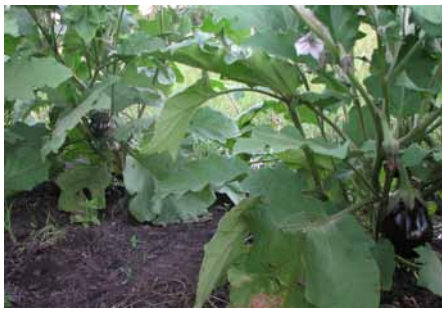
↑ Las primeras berenjenas