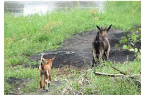
↑ Una cabra con su cría / La huerta ↓