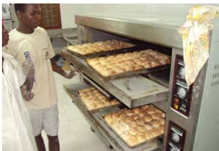
↑ La panadería