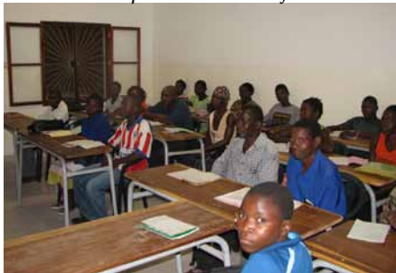
↑ La Escuela de alfabetización ↓