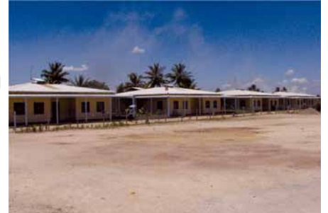
↑ Las cuatro casas-hogar

Con estas informaciones nos queda claro que la primera etapa del proyecto está yendo viento en popa; por eso, seguimos con el balance. Un segundo paso lo constituía el proyecto de reforestación de la parte del fondo de la finca, con el saneamiento del terreno y su nivelación, para hacerlo productivo. «Una buena alimentación es imprescindible para una buena salud. A eso ayudan los trabajos en la agropecuaria. En la parte agraria tenemos ya una buena extensión de huerta, cuyas primicias son